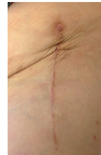
nach 4 Behandlungen