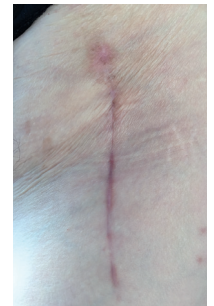
nach 10 Behandlungen